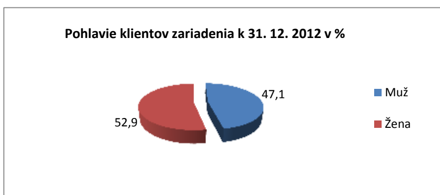
Graf č. 1: